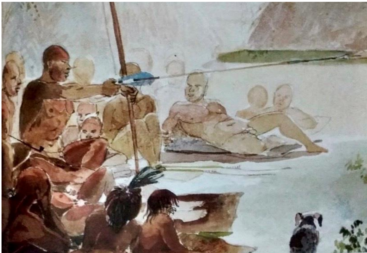
Figure n°6 – Jean-Baptiste Debret, Femme Camacan Mongoyo . Illustration extraite de l'ouvrage Voyage pittoresque et historique au Brésil de Jean Baptiste Debret , 1835.