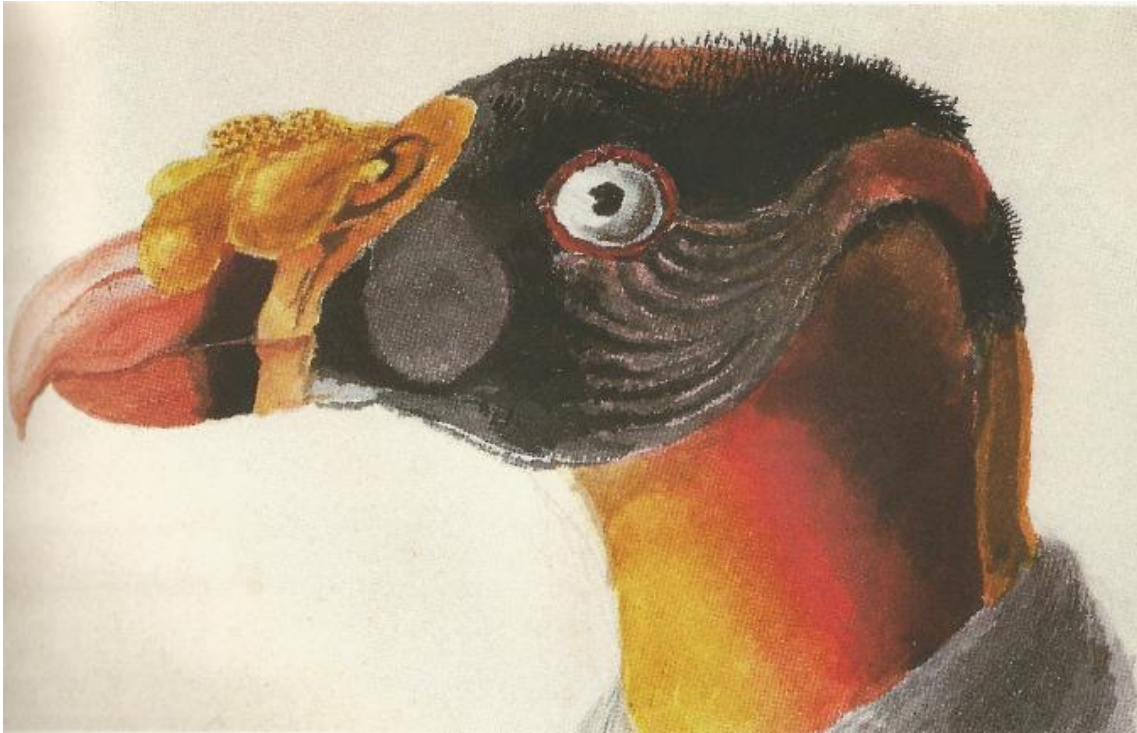
Figure n° 2 – Aimé Adrien Taunay, Sarcoranphus papa Linnaeus. Illustration extraite du catalogue Expedição Langsdorff ao Brasil, 1821-1829 , t. II, Aquarelas e desenhos de Taunay , Rio de Janeiro, Edições Alumbamento, 1988.

En dépit de la richesse documentaire, ses dessins et aquarelles ne sont pas diffusés à grande échelle. Mort par noyade lors de l'expédition, l'artiste n'a pas pu donner suite à un projet de publication personnelle, comme l'a fait par exemple Rugendas après son retour en Europe.