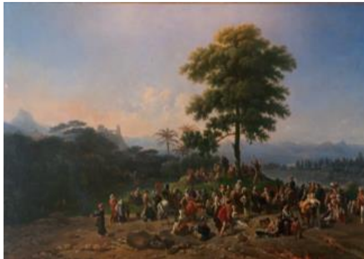
Figure n° 1 – Nicolas-Antoine Taunay, Prédication de saint Jean-Baptiste, s.d. , huile sur toile, 95 x 147 cm, Paris, Musée du Louvre. (Exposée au Salon des artistes vivants de 1819) 6 .

Les œuvres exposées dans les Salons français montrent l'influence de l'environnement tropical du Brésil sur la peinture de cet artiste de base néoclassique.