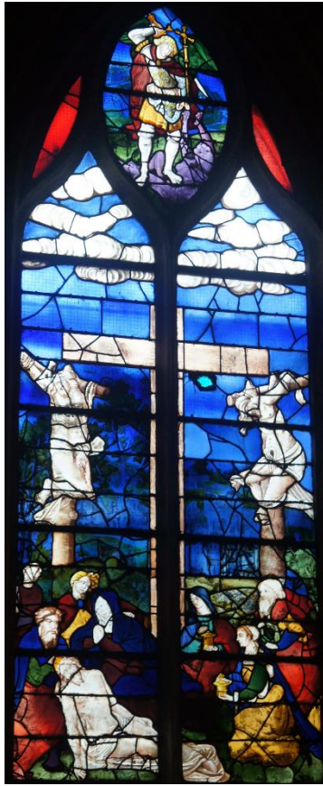
Figure n° 3 – Baie n°10, église Saint-Pierre de Montfort-L’Amaury (Yvelines), milieu du xvi e siècle 17