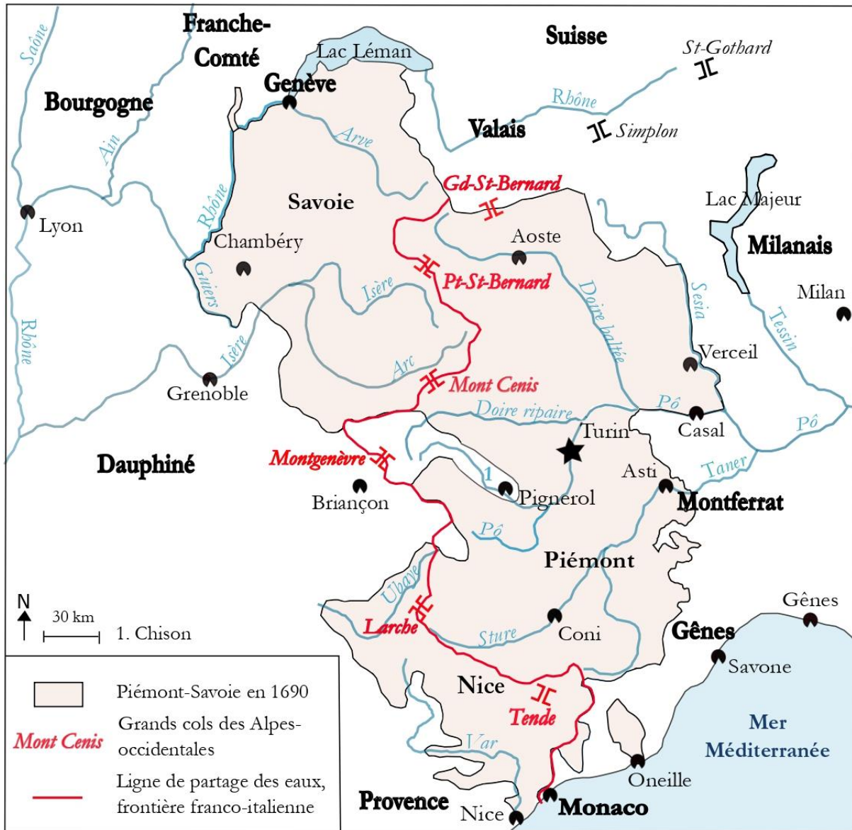
Carte 2 – Le Piémont-Savoie, « portier » des Alpes occidentales